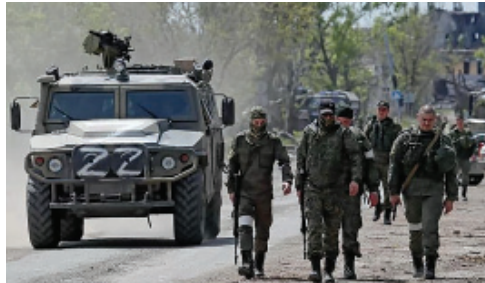
ХИЖІ ПРЕДСТАВНИКИ ТЕМНОЇ ЯВИ – РАШИСТСЬКІ ОКУПАНТИ-НЕЛЮДИ В УКРАЇНІ

Нині темна ява планети Земля вже втратила механізми прямих енергопольових крадіжок і вампірування духовних енергій Творця дарованих людям. Вона приречена на самопожирання власних енерго-польових ресурсів та поступове знищення.