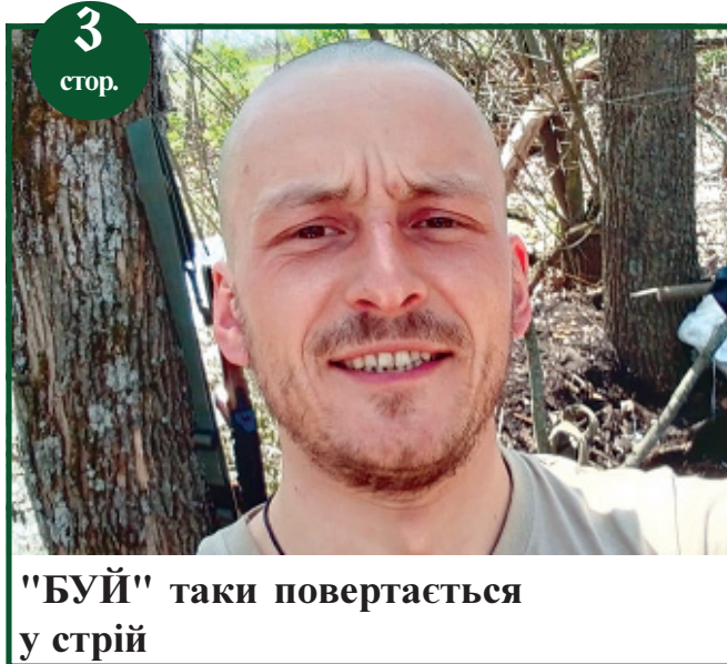
"БУЙ" таки повертається у стрій