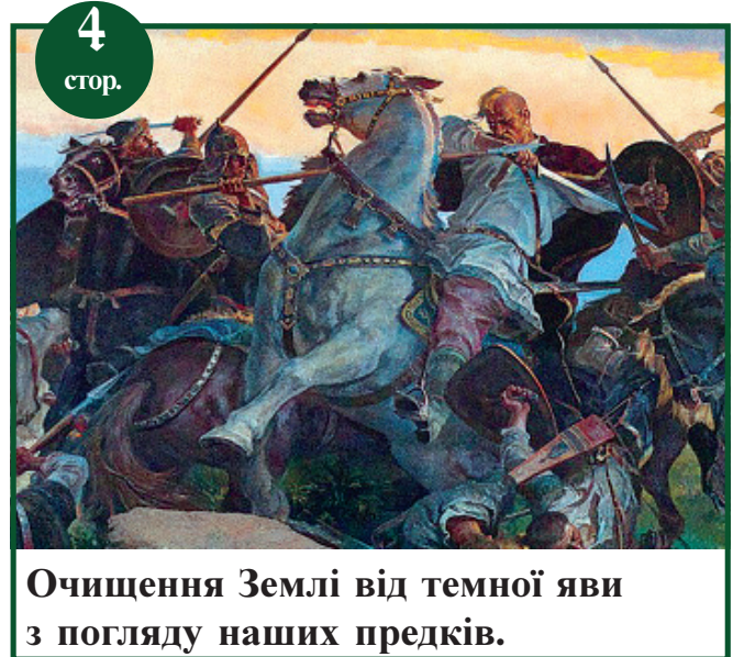
Очищення Землі від темної яви з погляду наших предків.