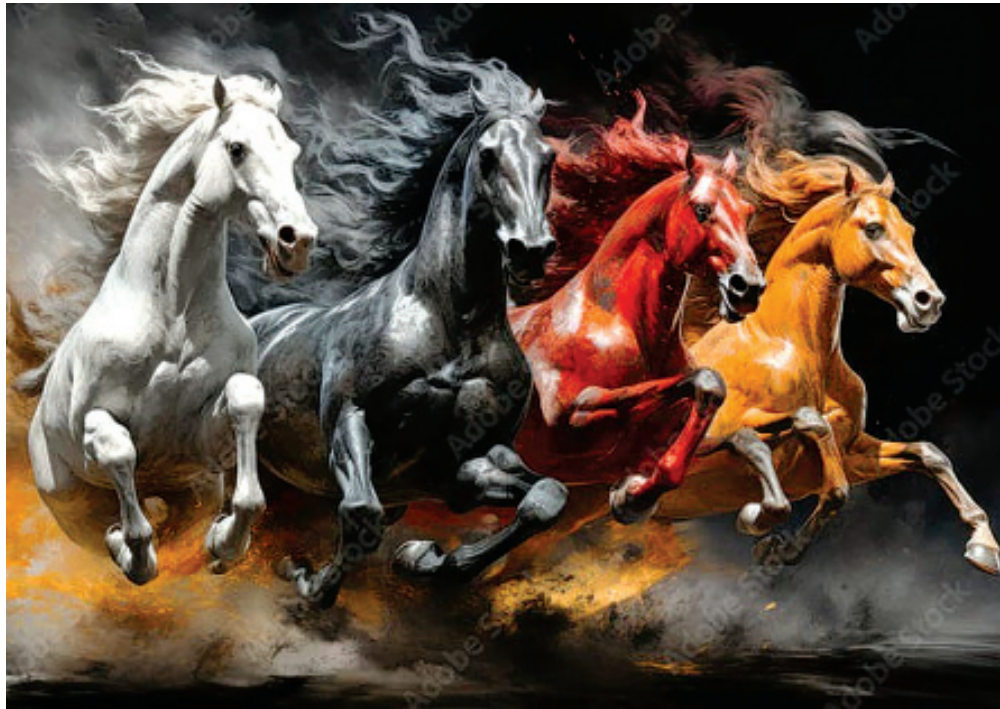
ВІСНИКИ АПОКАЛІПСИСУ ХХ СТОЛІТТЯ ОГОЛОСИЛИ ПОЧАТОК ОЧИЩЕННЯ МИРУ ЗЕМЛІ

Події в Мирі Землі, які тривають нині, оголошені майже дві тисячі років тому в Одкровенні Івана Богослова, кінцевій книзі Нового Заповіту – Апокаліпсисі. Означені книгою знаки, які віщували скорий початок таких подій, проявились у ХХ столітті. Розгортання ж самого Апокаліпсису почалось у другому десятилітті нашого століття. Головні ж події мають статись у наступні десятиліття. Очищення Миру Землі кардинально змінить його вигляд, позбавить темної яви, всього нелюдського, хижого, духовно неприйняттого. Є свідчення того, що Армія Господня вже отримала відповідні енергопольові ресурси для виконання задуманого Творцем.