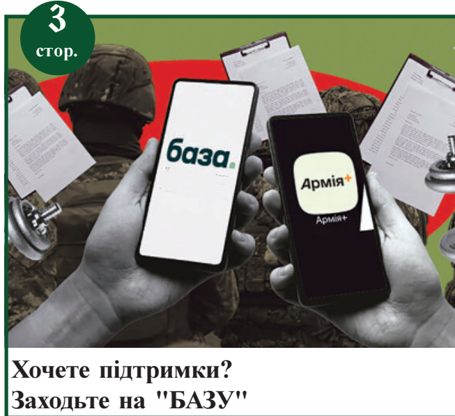
Хочете підтримки? Заходьте на "БАЗУ"