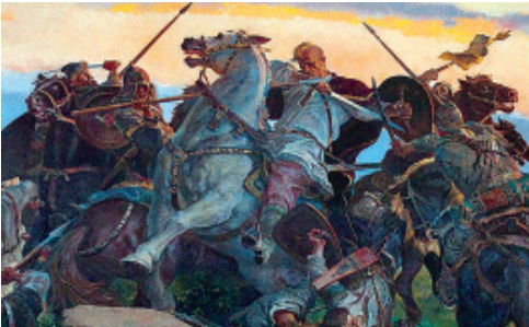
СВІТЛЕ ЛІКВІДУЄ ТЕМНЕ: БІЙ СВЯТОСЛАВА ХОРОБРОГО З НОСІЯМИ ТЕМНОЇ ЯВИ

Але, що в принципі можна називати темною явою? Що має бути очищено Апокаліпсисом? Хто і що є носіями хижого і неприйняттого для Прави? Про яке очищення казали духовні провідники далекого слов'янського, українського минулого, знавці православного світогляду – Рахмани, Характерники, Арії?